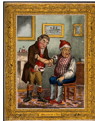
Sunda vätskor? Idén om att utvinna av kroppsvätskor ger bättre hälsa (och till och med kan verka livräddande) övergavs av europeiska läkare vid den moderna medicinvetenskapens genombrott under 1800-talet.

Bild: An ill man being bled by his doctor. Färglagd etsning av J. Sneyd, 1804, efter J. Gillray.